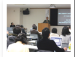
昨年12月開催のセミナー

今後は、こうした事業の更なる継続と支援が、一般的な子育ての枠にとらわれることなく、社会全体としての理解と支援の求められる障がい児の分野に置いてこそ必要であり、個々の意志や性格に合わせたキメ細やかな支援のあり方と、それに関わる人材の育成をも含めた新たな施策、教育システムの確立をのぞむとともに、大いに期待するものである。